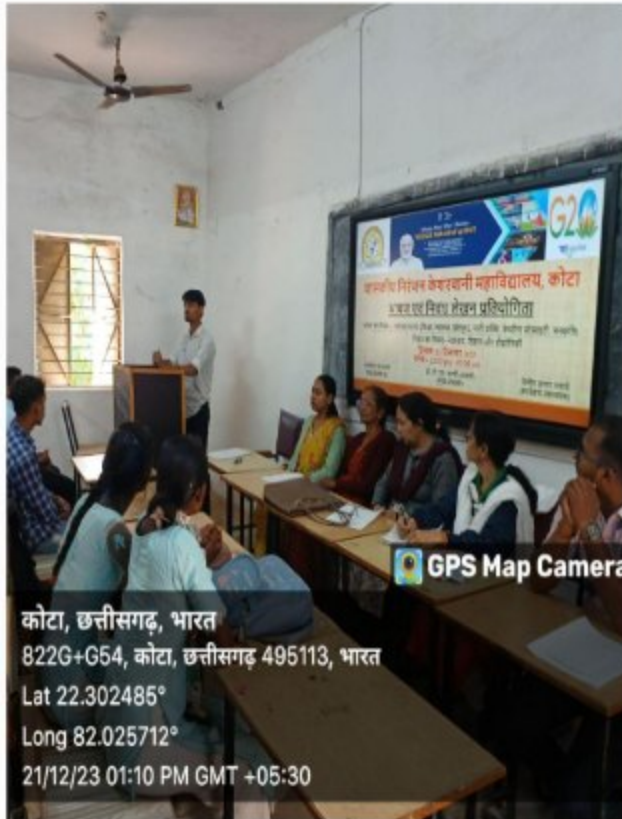
कोटा, छत्तीसगढ़, भारत 822G+G54, कोटा, छत्तीसगढ़ 495113, भारत Lat 22.302485° Long 82.025712° 21/12/23 01:10 PM GMT +05:30