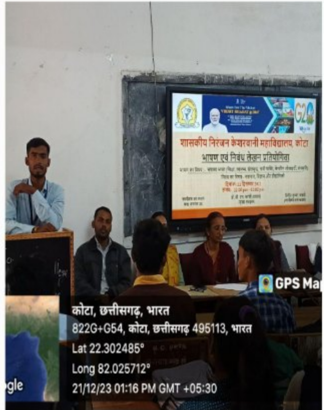
कोटा, छत्तीसगढ़, भारत 822G+G54, कोटा, छत्तीसगढ़ 495113, भारत Lat 22.302485° Long 82.025712° 21/12/23 01:16 PM GMT +05:30