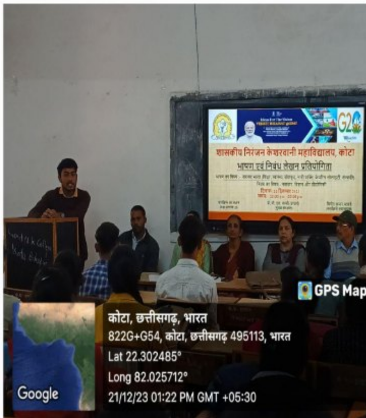
कोटा, छत्तीसगढ़, भारत 822G+G54, कोटा, छत्तीसगढ़ 495113, भारत Lat 22.302485° Long 82.025712° 21/12/23 01:22 PM GMT +05:30