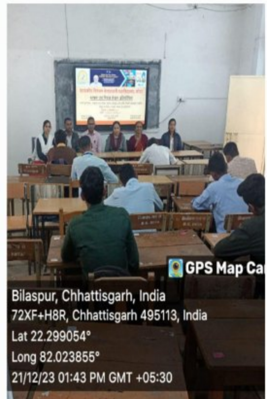
Bilaspur, Chhattisgarh, India 72XF+H8R, Chhattisgarh 495113, India Lat 22.299054° Long 82.023855° 21/12/23 01:43 PM GMT +05:30